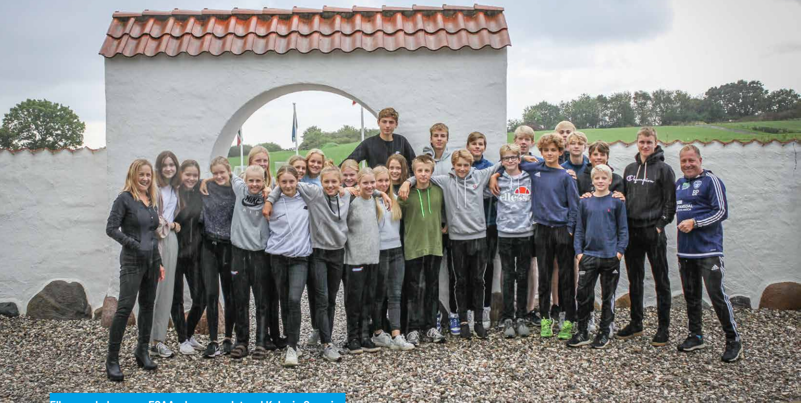
Ellevangskolens nye ESAA-elever samlet ved Kaløvig Camping